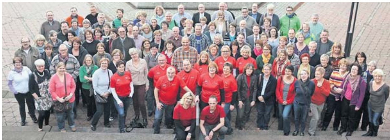
Das Nordic-Walking-Team von „Fit für 10“ hat schon fleißig mit den Trainern (Mitte) die Technik geübt. Nun geht's darum, auch die Ausdauer zu verbessern.